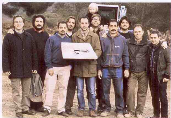
Il gruppo che ha realizzato la residenza dell'Avge.

Si vede che aveva ragione lui: il Comune di Porto Azzurro individua un